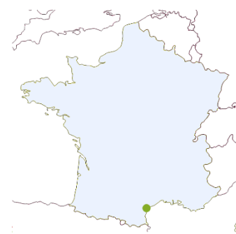
Lieu d'expérimentation de la variété

Variété à rendements élevés sélectionnée pour la production de vins qualitatifs à faible teneur en alcool. Ses vins sont équilibrés, avec une typicité muscat, souvent accompagnée d'arômes de rose, litchi, pêche blanche.